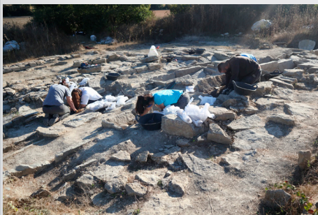
Arkeologia jarduera arkeologikoa Larrarako Andra Maria tenpluan, Dulantzi.