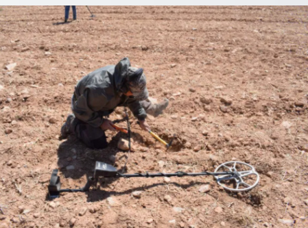
Baimendutako jarduera Cabez de Alcalá (Azaila, Teruel) aztarnategian.

Objektu txikia bada eta desagertzeko edo hondatzeko arrisku larria badago, kontu handiz batu eta poltsa batean sartu behar duzu. Ez garbitu; aitzitik, objektuak inguruan zuen lur apur batekin mantentzea komeni da. Ez ahaztu aurkikuntza egin duzun lekuaren kokapena jaso behar duzula. Deitu lehenbailehen BIBAT - Arabako Arkeologia Museora eta zita bat eskatu objektua entregatzeko.